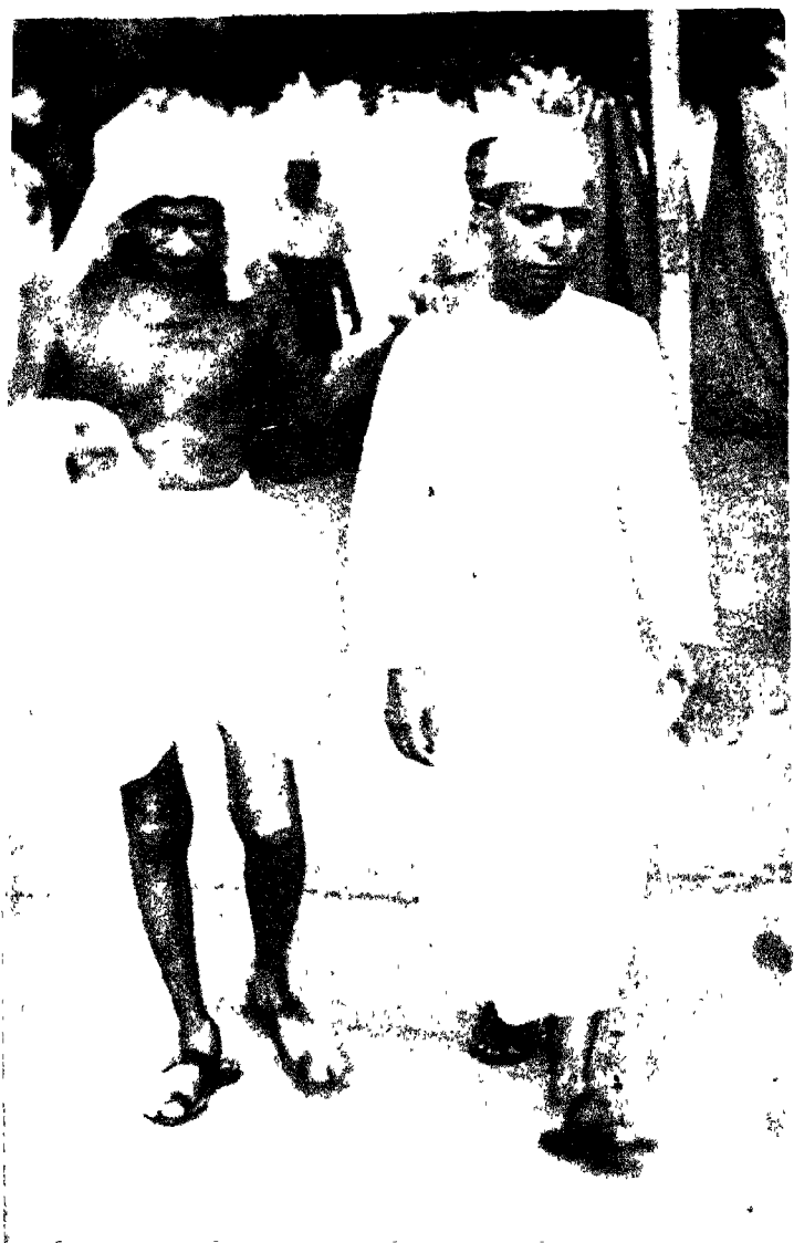
लिखक चाप के साथ